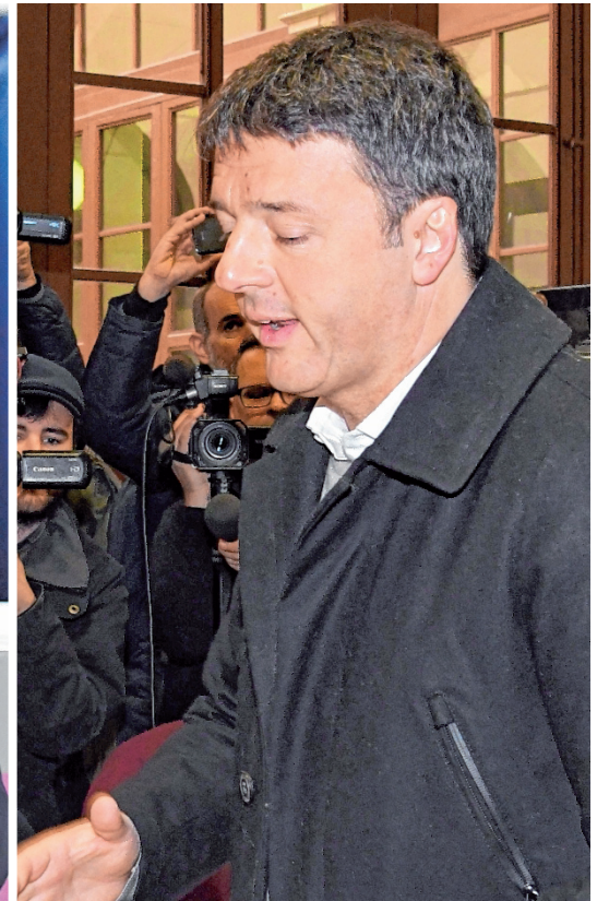
Wahlverlierer: die Ex-Premiers Silvio Berlusconi (links) und Matteo Renzi.