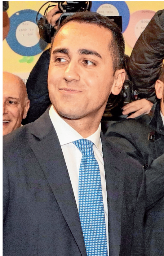
Wahlgewinner: Lega-Chef Matteo Salvini (links) und „Fünf Sterne“-Chef Luigi Di Maio.